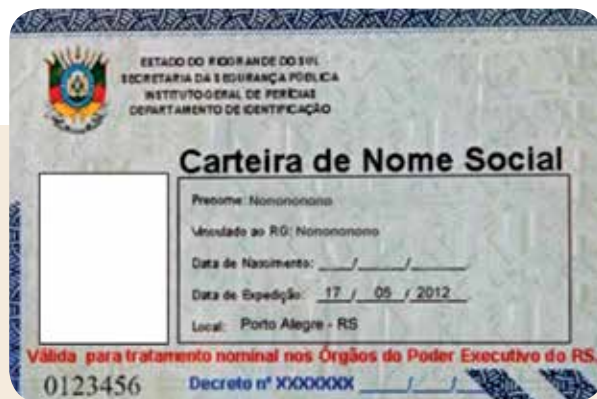
Modelo de primeira carteira de Nome Social emitida no Rio Grande do Sul

A Carteira de Nome Social (CNS), que tem função de carteira de identidade, permite que travestis e transexuais sejam identificadas por nomes femininos. Numa iniciativa pioneira no País, o Rio Grande do Sul implantou o documento por meio do Decreto nº 49.122, de 17 de maio de 2012. Instituída para travestis e transexuais