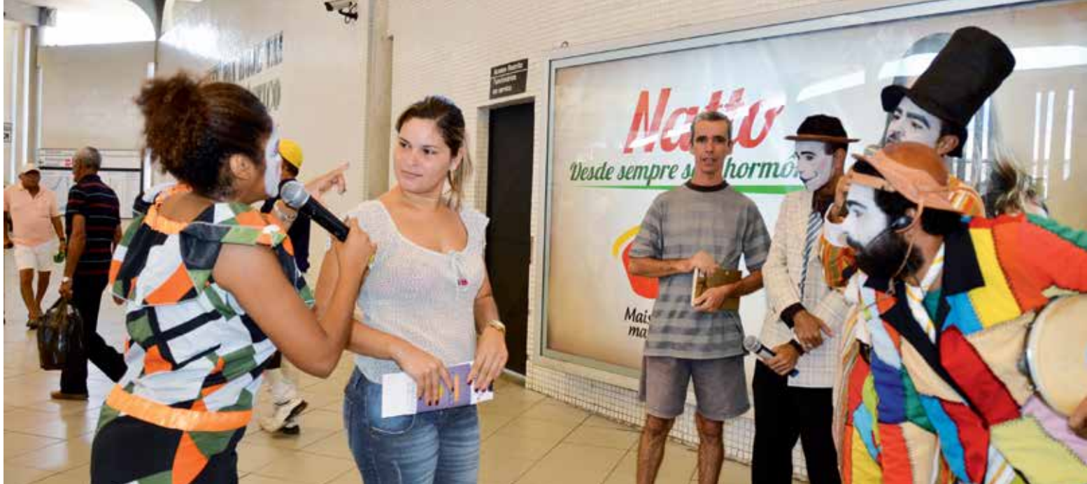
Atores interagem com passageiros do metrô para difundir a Lei Maria da Penha

vas de urgência, que obrigam o agressor a manter-se afastado da mulher, da casa ou do local de trabalho”, explicou.