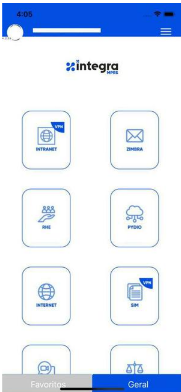
Desenho da tela para acesso interno

(/media/atuacao/2020/11/52015_650_650__vcvcdffdfd.jpg)