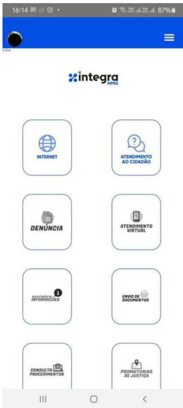
Design da tela para acesso externo

(/media/atuacaoomp/2020/11/52015_650_650__bv/bv/bt/52015_650_650__bv/bv/bt.jpg)