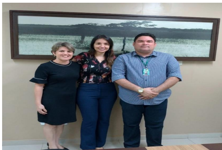
CAOP-IJE discute tratativas com a Promotoria de justiça de Vitória do Jari para a implantação do Serviço Família Acolhedora.