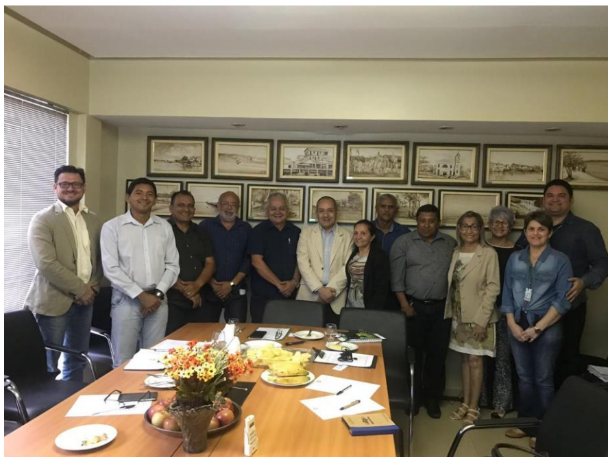
Foto 02 - Reunião com os prefeitos dos 16 municípios do Estado para tratar dos Projetos Estratégicos: Escuta Especializada e Serviço Família Acolhedora.