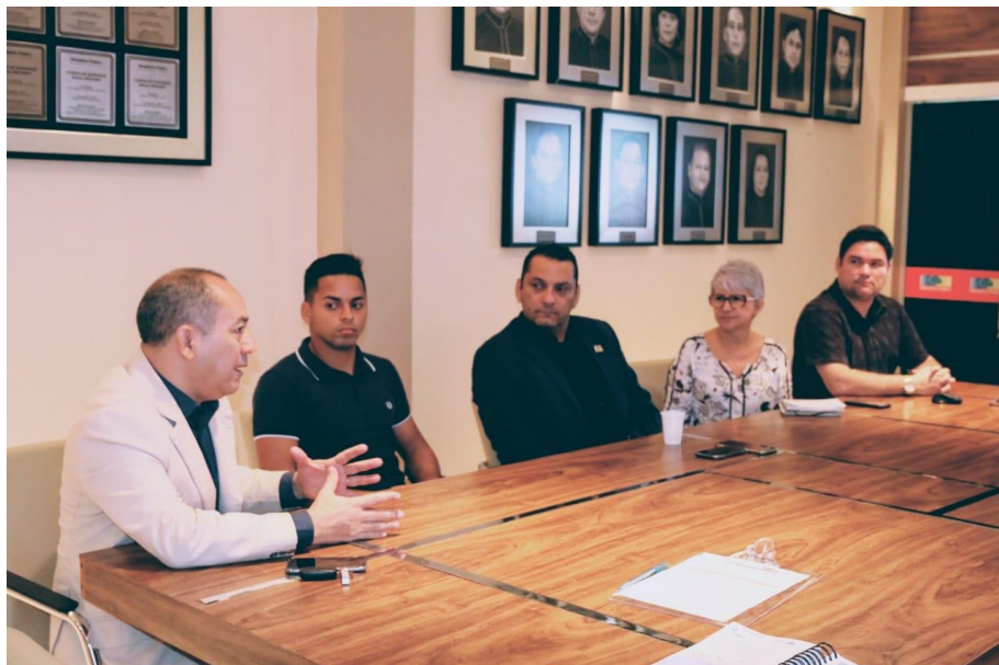
Foto 01 - Reunião com o presidente da AMEAP para apresentação formal do Projeto Estratégico.