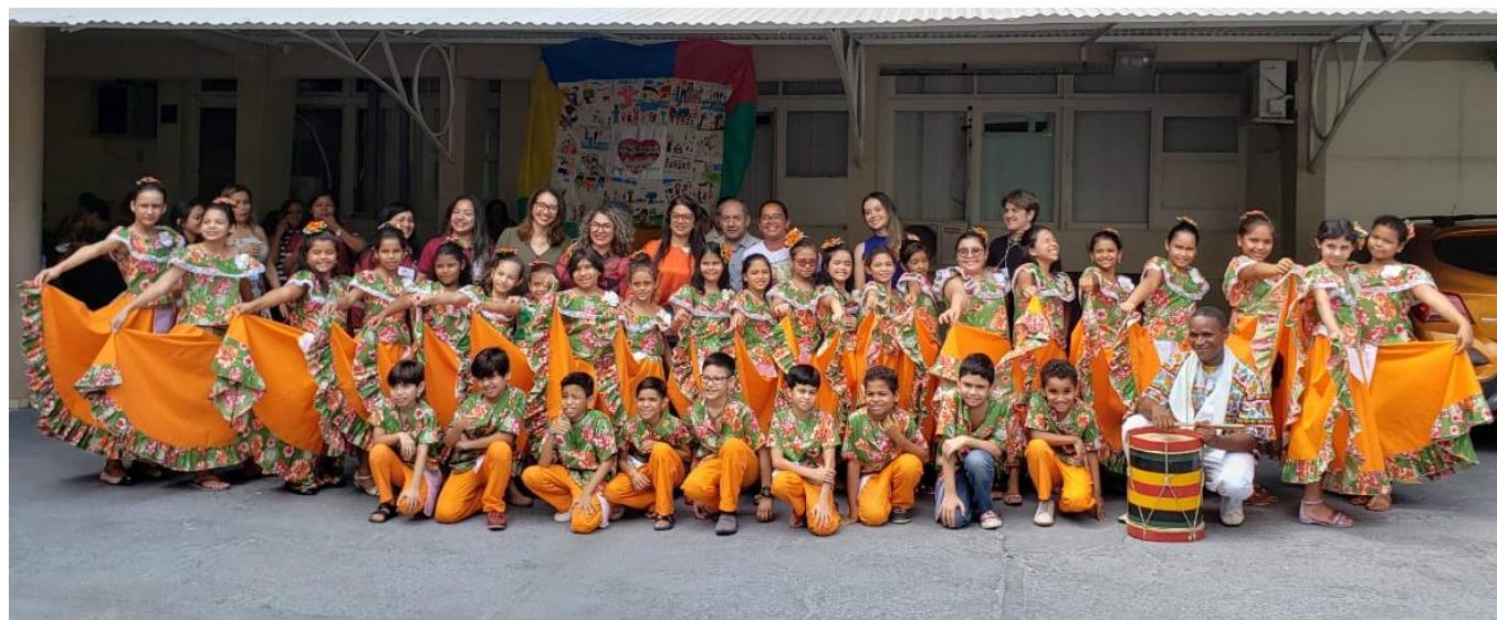
Foto 04 - Apresentação cultural do Marabaixo (dança típica amapaense) realizada por crianças da rede pública de ensino de Macapá.