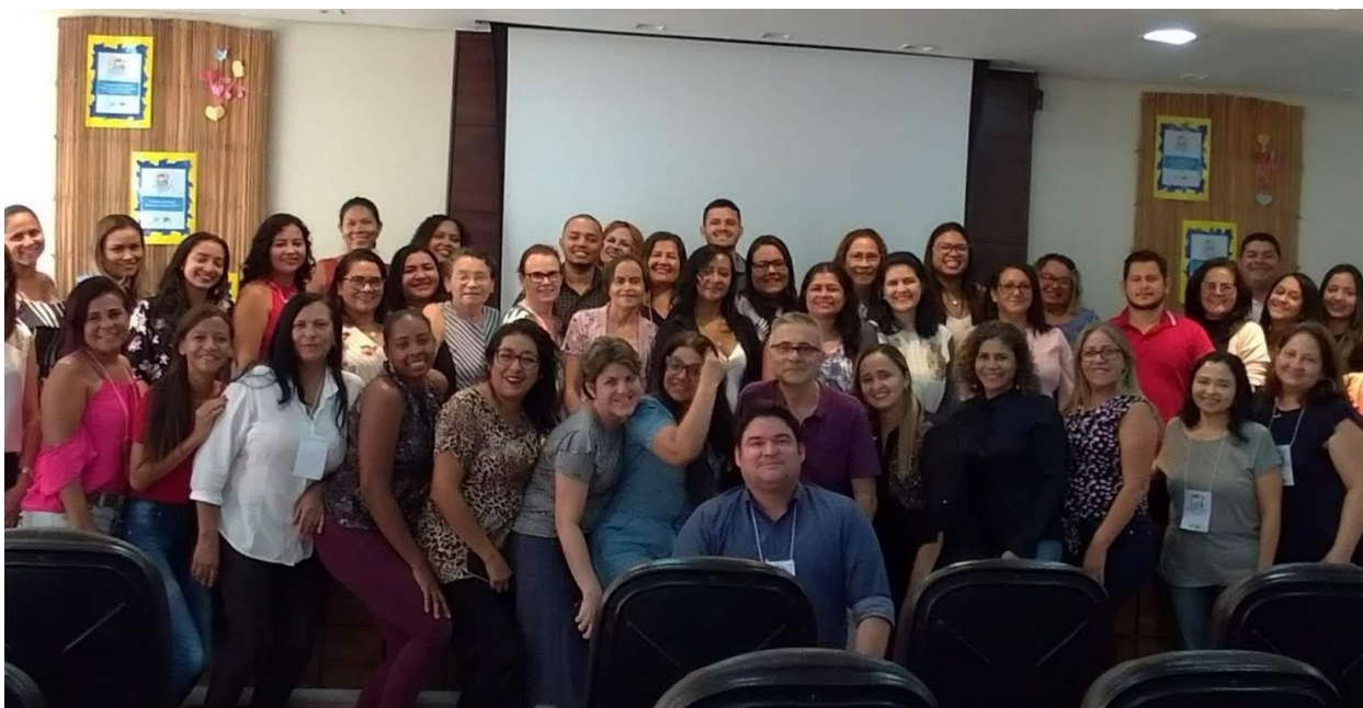
Foto 06 - Momento final do Encontro Formativo.