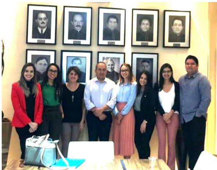
Diálogo sobre o Serviço Família Acolhedora com a Associação das Defensoras e Defensores Públicos do Amapá.