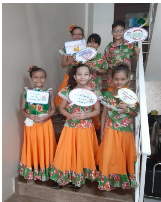
Foto 03 - Crianças na acolhida aos participantes do Encontro Formativo.