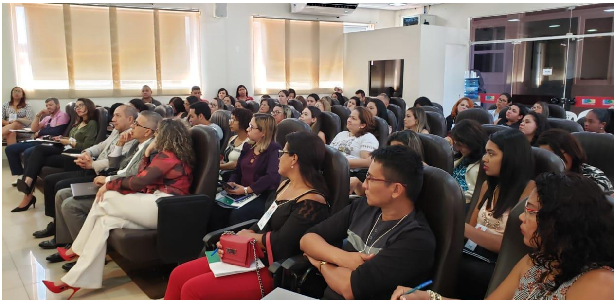
Foto 05 - Plenária do Encontro Formativo.